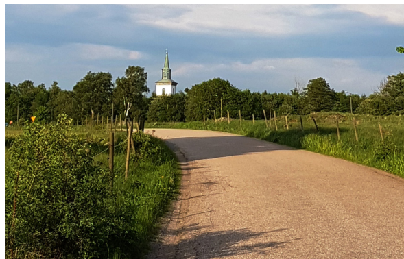
Stafsinge kyrka, precis nordöst om tomtområdet.

Inom 500 meter från bostadsområdet finns det till exempel två förskolor medan grundskola och gymnasium endast är 10 minuter bort med cykel. Till centrum är det två kilometer och till närmaste livsmedelsaffär endast 600 meter. Det är även enkelt att ta sig både till tågstationen och motorvägen härifrån.