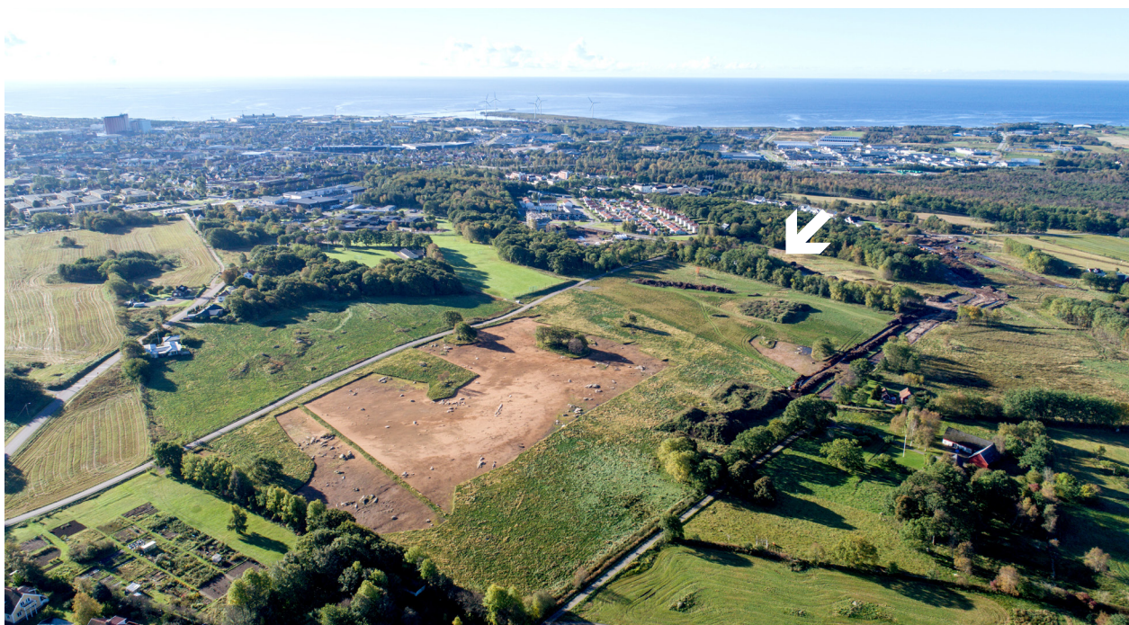
Vy över området från norr till söder. Markanvisningens läge markerat med vit pil.